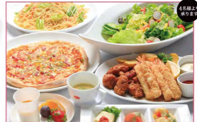
洋風プラン 天然温泉入浴付 前菜・スープ・デザート ※ピザ・パスタ・サラダ・揚げ物(4人前) 2,800円(税込)