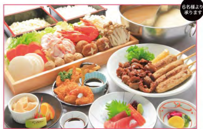
選べる味 二層鍋 天然温泉入浴付 前菜・刺身・揚げ物・香の物・デザート ※鍋・焼物・うどん又はご飯(4人前) 3,800円(税込)