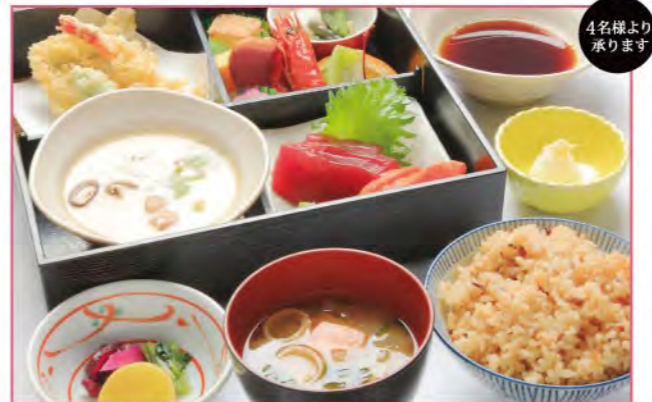
季節満喫御膳 天然温泉入浴付 ※(1人前) 2,800円(税込)