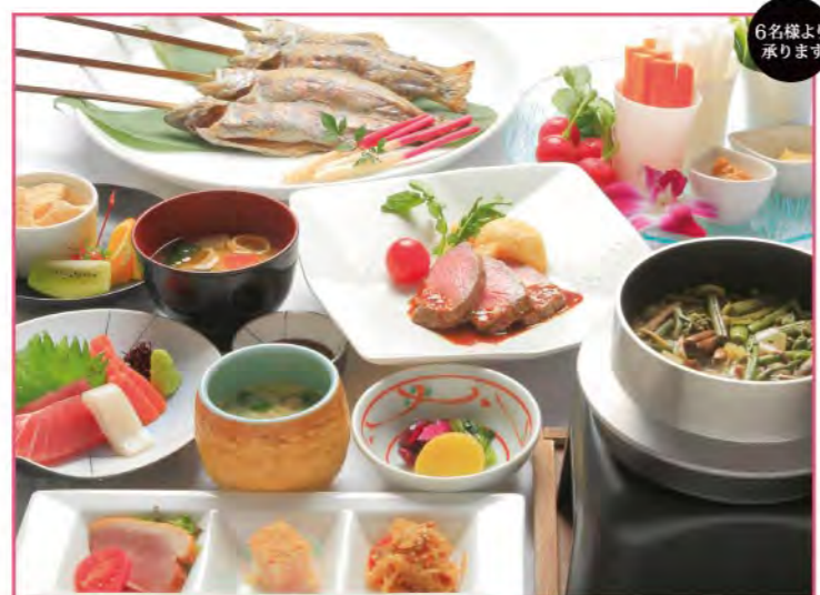
川根特選プラン 天然温泉入浴付 前菜・刺身・茶碗蒸し・肉料理・留挽・香の物・デザート ※釜飯(2人前)・川魚焼(4人前) 5,000円(税込)