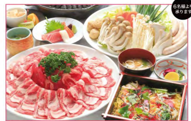
焼きしゃぶ 天然温泉入浴付 前菜・刺身・茶碗蒸し・留挽・香の物・デザート ※野菜盛り・肉盛り・ちらし寿司(4人前) 4,200円(税込)